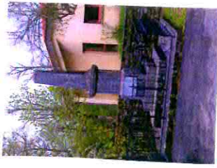
Monument aux morts à Camburat