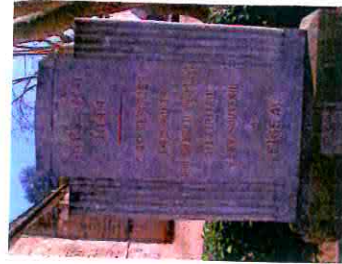
Stèle de la place du 12 mai 1944

Principal lieu de mémoire pour tous, la place de la gendarmerie dite du 12 mai 1944 est celle où 540 personnes furent parquées, en attendant leur déportation par les soldats de la division Das Reich appliquant le système de terreur nazi. 77 ne reviendront pas.