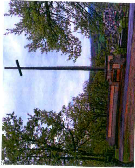
Monument du Cingle sur les hauteurs de Figeac

Nous, élèves de T°ES-L, dans le cadre de l'Education Civique Juridique et Sociale, avons ressenti l'intérêt de commémorer d'une autre manière les événements du 10 et 11 mai 1944 en portant notre intérêt sur la ville elle-même. Nous avons décidé d'établir un parcours pédestre qui passerait par Figeac, la Déganie, Planioles, ce qui permettrait aux promeneurs de profiter de leurs randonnées dans un cadre somptueux, tout en s'informant sur ceux qui les ont précédés sur ces chemins et sur les événements du passé. En effet, les stèles leur rappelleront que Figeac n'a pas été épargné et que nous devons toujours garder en mémoire cette atrocité humaine. Ces parcours nous semblent un bon moyen pour que les citoyens de Figeac et des alentours se confrontent de manière permanente au passé historique de leur ville, sans être obligés d'assister à une commémoration collective. Pour les gens, commémorer, c'est se souvenir dans un acte collectif et public d'événements dont l'objet est un personnage ou un fait passé, auquel la collectivité attribue un rôle important à un moment de son histoire. C'est un moyen de participer à une manifestation fixe et permanente. Selon nous, l'indifférence gagne les commémorations. Cela pose le problème de la mémoire et des formes de commémorations à inventer peut-être... Nous n'avons pas besoin de commémorer forcément ensemble pour nous souvenir d'un événement passé.