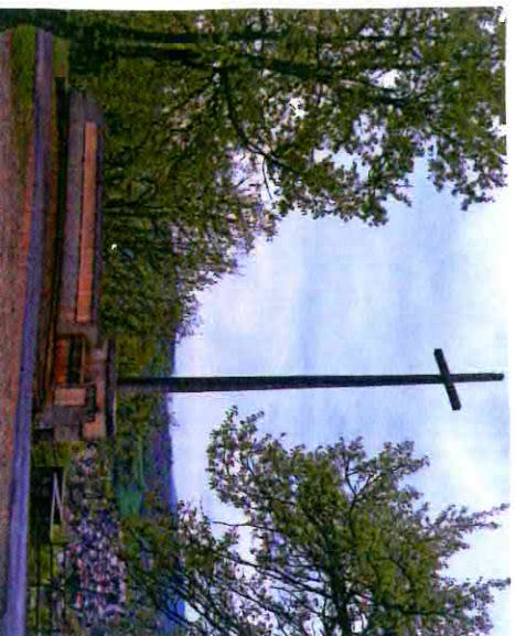
Monument du Cingle sur les hauteurs de Figeac.

Les prisonniers rafiés ont décidé d'un commun accord que les survivants, à leur retour à Figeac, feraient ériger un monument en souvenir des détenus et des morts durant cette rafle. Ce monument devait être vu de tout Figeac et être éclairé la nuit. Mis effectivement en place en 1948, on y a inscrit les 150 noms de tous les morts figeacois pendant la guerre (déportés, tués et les 77 morts parmi les déportés de la rafle du 12 mai). Il y a des noms aussi marqués dans le cimetière.